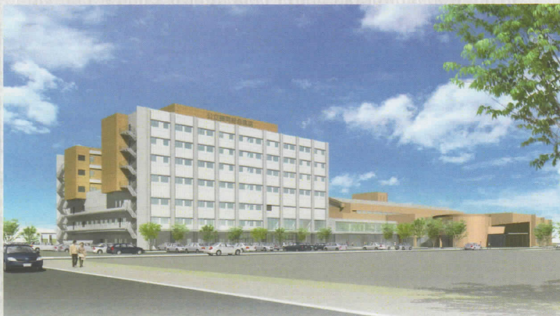
新病院完成イメージ

TEL. 0274-22-3311 (代表) FAX. 0274-24-7002